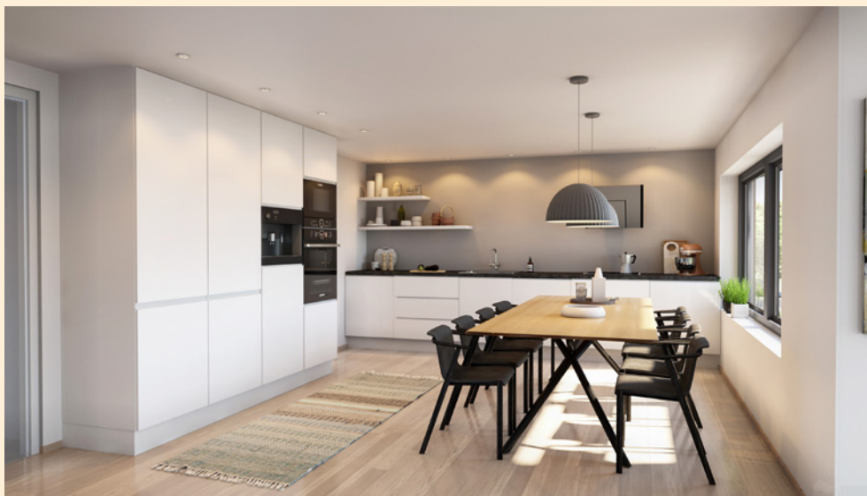
Illustrasjonstegninger. Innfelt peis er ikke del av standardleveransen.